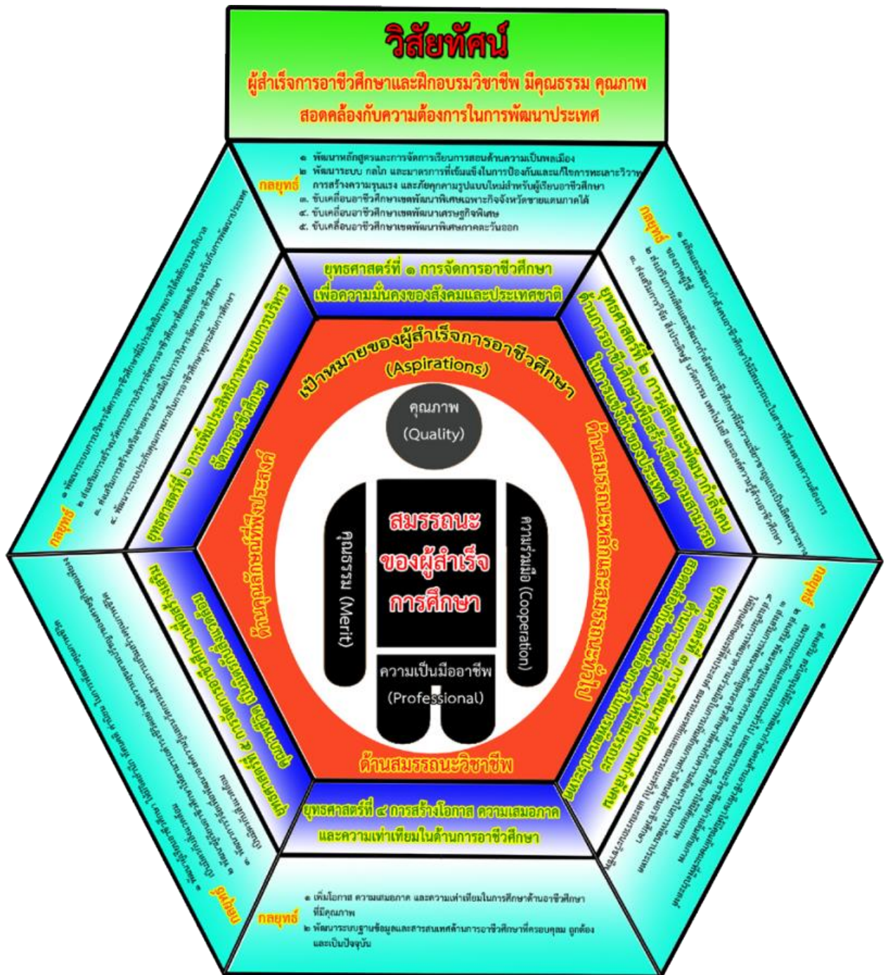
การนำแผนพัฒนาการอาชีวศึกษา พ.ศ.๒๕๖๐-๒๕๗๙ สู่การปฏิบัติ